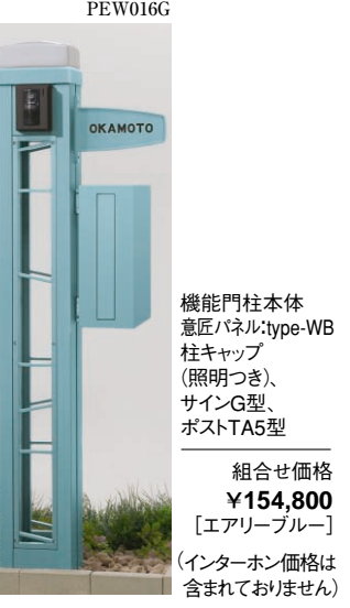
機能門柱本体 意匠パネル: type-WB 柱キャップ (照明つき、 サインG型、 ポストTA5型) 組合せ価格 ¥154,800 [エアリーブルー] (インターホン価格は 含まれておりません)