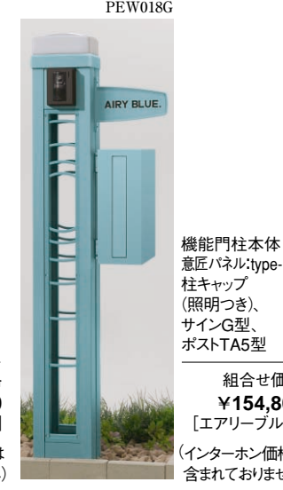
機能門柱本体 意匠パネル: type-RB 柱キャップ (照明つき、 サインG型、 ポストTA5型) 組合せ価格 ¥154,800 [エアリーブルー] (インターホン価格は 含まれておりません)

ご案内 ●ポスト・サインは任意の位置に取付けできます。●意匠パネルは、上下・左右の向きを変えて取付けできます。●溝ふさぎカバーをご使用いただくとポール外観をより美しく仕上げるすることができます。