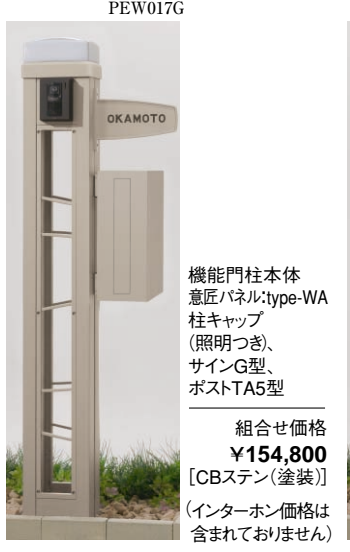
機能門柱本体 意匠パネル: type-WA 柱キャップ (照明つき、 サインG型、 ポストTA5型) 組合せ価格 ¥154,800 [CBステン(塗装)] (インターホン価格は 含まれておりません)