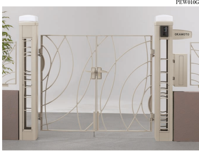
機能門柱本体+意匠パネル type-RB 柱キャップ(照明つき:2) サインG型 ポストTA5型、ナビアスタイル門扉 両開き type-R(α+β) サイズ:0712 ¥410,200 [CBステン(塗装)] (インターホン価格は含まれておりません)