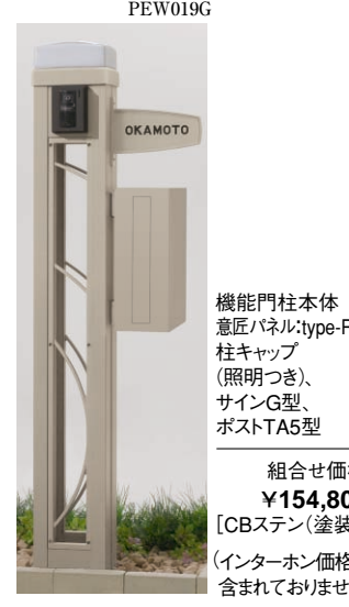
機能門柱本体 意匠パネル: type-RA 柱キャップ (照明つき、 サインG型、 ポストTA5型) 組合せ価格 ¥154,800 [CBステン(塗装)] (インターホン価格は 含まれておりません)