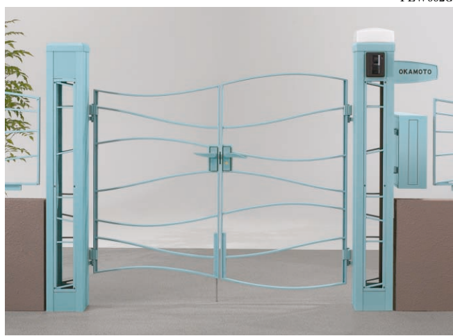
機能門柱本体+意匠パネル type-WB 柱キャップ(照明つき・照明なし各1) サインG型 ポストTA5型、ナビアスタイル門扉 両開き type-W(α+β) サイズ:0712 ¥395,700 [エアリーブルー] (インターホン価格は含まれておりません)