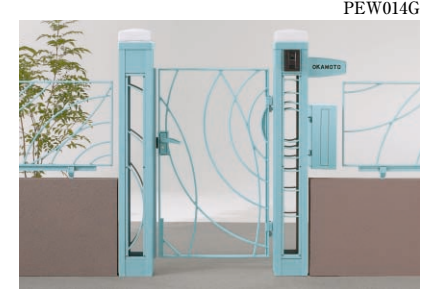
柱キャップ(照明つき:2) サイン、ポスト ナビアスタイル門扉 type-R・α サイズ:0712 ¥345,100 [エアリーブルー] (インターホン価格は含まれておりません)