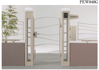
柱キャップ(照明つき:2) サイン、ポスト ナビアスタイル門扉 type-W・β サイズ:0712 ¥345,100 [CBステン(塗装)] (インターホン価格は含まれておりません)

ご案内 ●サイズや納まりにより、意匠パネルと門扉の組合せが変わりますので、[P.170]の組合せ表をご確認ください。